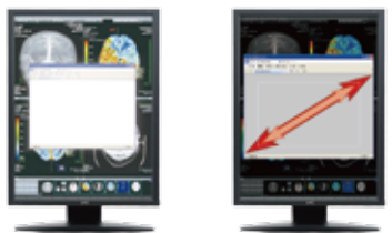
[オートテキストモード機能イメージ]

オートテキストモード機能は、テキスト(白)表示面積に応じて自動的に画面輝度を調整する機能です。