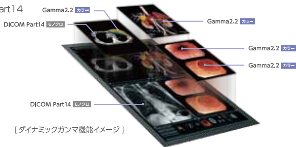
[ダイナミックガンマ機能イメージ]