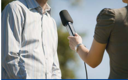
取材・ドキュメンタリー

ディレクターカメラや報道取材用に最適な小型・軽量ハンドヘルドカメラ。機動性に優れ、女性カメラマンにも使いやすい操作性を実現。インタビューマイクでの収録が可能な2チャンネルXLR音声入力端子を装備。