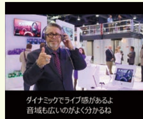
ダイナミックでライブ感があるよ 音域も広いのがよく分かるね

動画教材を再生しながら、場面を選択して字幕を作成・編集し、映画のようにセリフなどを表示させることができます。グループワークで会話の聴き取り、翻訳、セリフ作りを行い発表するなど、学習者の学習・創作意欲を高める主体的な授業が展開できます。