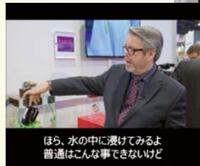
ほら、水の中に浸けてみるよ 普通はこんな事できないけど